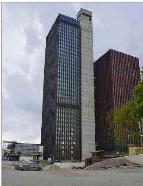
Fast unverändert erheben sich die beiden Bauten über alle anderen Gebäude in Raderthal und Marienburg.